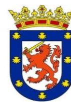
Municipalidad de Santiago